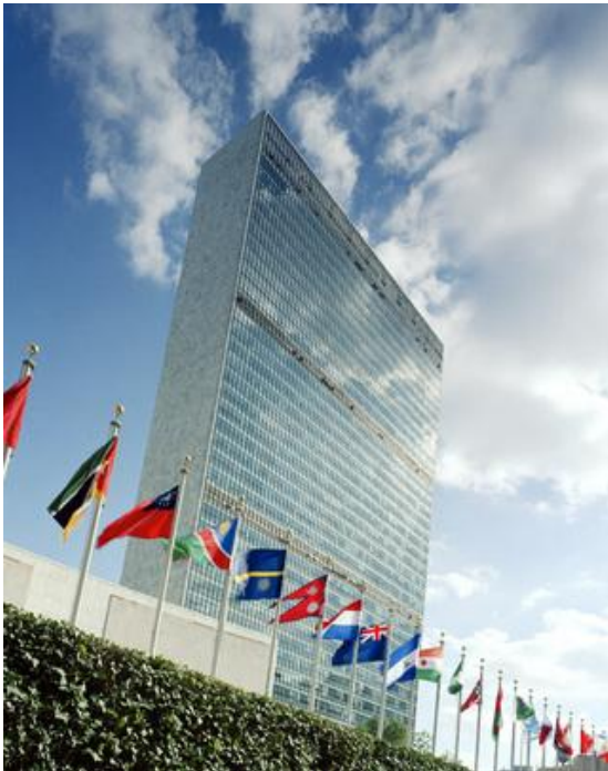
Sede Naciones Unidas, Nueva York

El pasado 9 al 18 de Julio se desarrolló en Nueva York el Foro Político de Alto Nivel sobre Desarrollo Sostenible. Durante el mismo se hizo un seguimiento y revisión de la agenda de los Objetivos de Desarrollo Sostenible (ODS). El WBCSD (World Business Council for Sustainable Development), nuestra organización madre, participó de los días de trabajo. Aquí les presentamos los puntos más relevantes.