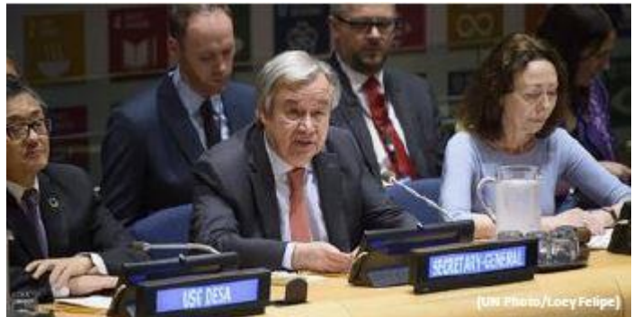
Secretario General António Guterres (centro) se dirige en la sesión de cierre del Foro Político de Alto Nivel, sobre Desarrollo Sostenible

un rol clave: El sector privado estuvo altamente implicado por representantes de delegaciones de países y CEOs. Amina J. Mohammed, Deputy Secretary-General de las Naciones Unidas, quien subrayó los roles críticos que dinámicamente tiene que jugar en la realización de la agenda de los ODS y aclaró que “es alentador ver a las empresas responder a la agenda 2030 en una escala sin precedentes”. El nivel y calidad de involucramiento de los líderes de negocios en los eventos y durante el curso del Foro de Alto Nivel puso de manifiesto un claro compromiso de la comunidad empresaria a ser parte de estos debates con una visión orientada a alcanzar su potencial para impulsar soluciones comerciales impactantes en el camino hacia 2030.